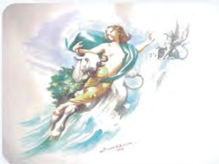
Il ratto di Europa (The abduction of Europa)

http://www.politicheeuropee.it/attivita/19826/cooperation-in-the-anti-fraud-sector http://ec.europa.eu/anti_fraud/about-us/funding/index_en.htm